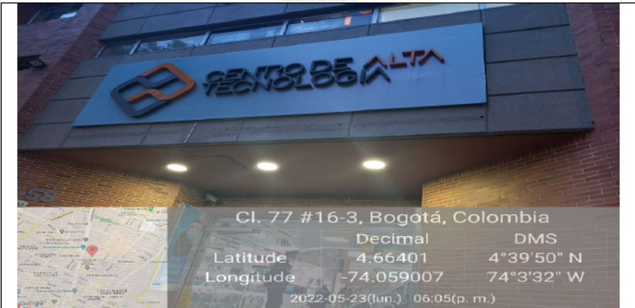
Foto del aviso divisible No. 1 cuenta con registro otorgado SCAAV-01753